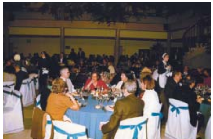
El Día del Profesional de la Educación es un buen momento para el encuentro

Esta reunión anual es un merecido Homenaje que el Ayuntamiento roceño rinde a los hombres y mujeres que dedican su esfuerzo a la educación, labor imprescindible de formación de los que serán los ciudadanos del futuro, profesionales de todas las instituciones docentes de nuestro municipio; educadores de los Colegios públicos, privados y concertados, así como de los Institutos de Educación Secundaria, Escuelas Infantiles, Escuela Oficial de Idiomas, la Escuela de Adultos y Garantía Social, son los protagonistas de este Día.