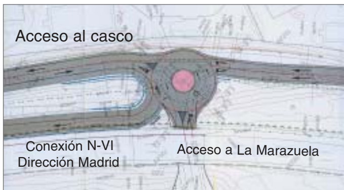
Proyecto de la glorieta de nueva conexión a la N-VI