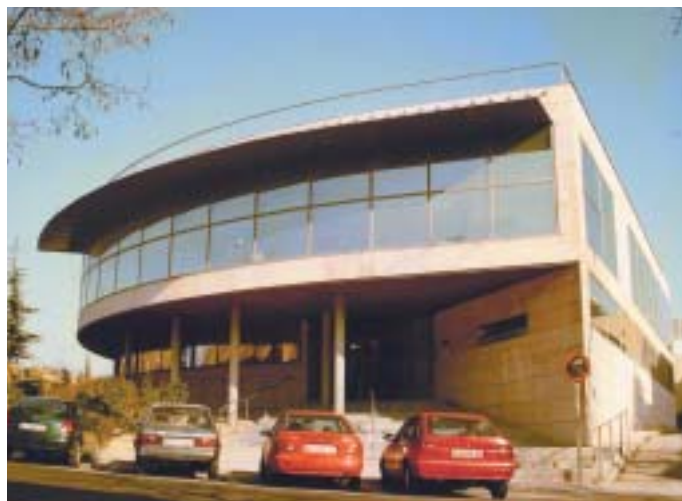
En la imagen, el Centro de Salud de Las Rozas

Por su parte, el Instituto de Salud Pública aporta una dotación de 37.864 euros , así como la colaboración del personal técnico .