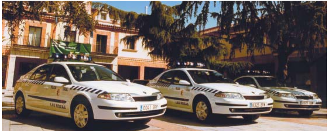
El pasado mes de mayo, se amplió la flota de vehículos de la Policía Municipal.

De esta manera, el municipio roceño ya cuenta con la presencia de 26 nuevos agentes , que se unen a los 50 existentes .