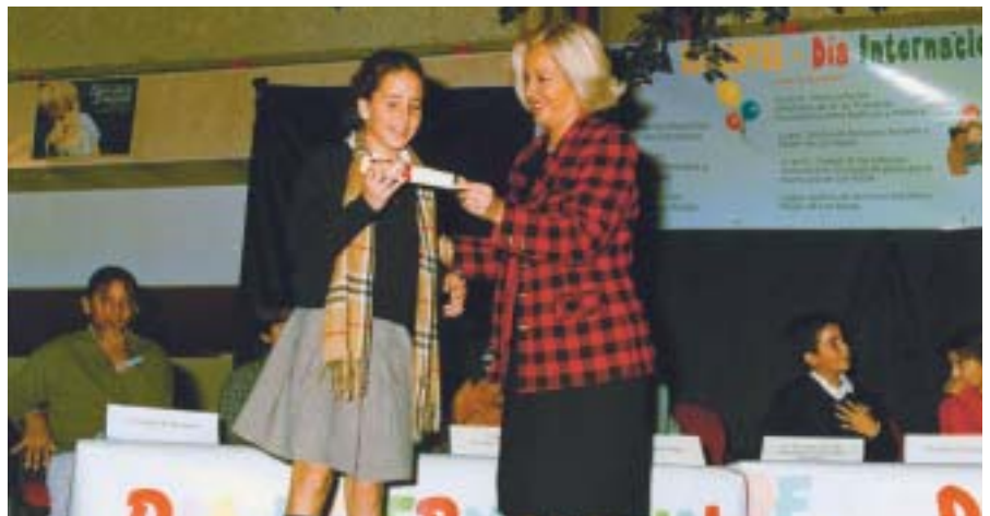
La Concejala de Servicios Sociales y Mujer entrega un diploma a su "colega" infantil.

Además, se organizarán Talleres, un "Juego de Ciudad", Jornadas intergeneracionales y la exposición " La Ley de los niños " realizada por