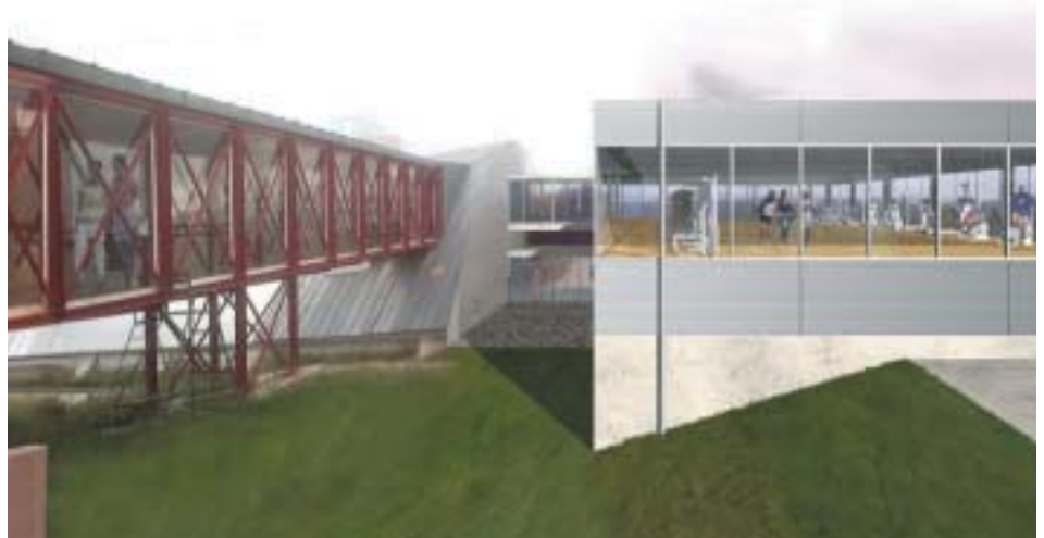
Este pabellón completa, de forma evidente, las instalaciones deportivas de Entremontes

En este caso, se trata del proyecto de construcción de un pabellón anexo a la piscina cubierta de este recinto polideportivo, en el cual se albergarán tanto los vestuarios de la citada instalación como un gimnasio que ampliará la oferta deportiva existente en esta zona del municipio.