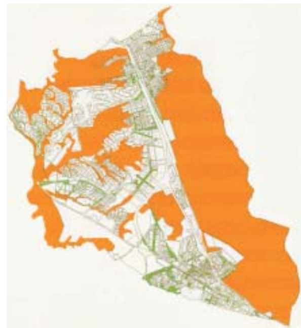
Las Rozas es uno de los municipios de la Comunidad de Madrid que cuenta con un mayor número de zonas verdes en relación a su extensión.