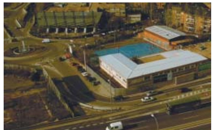
En la imagen, actual conexión a la N-VI, que desaparecerá

Junto con las obras de peatonalización y túnel de conexión en la Calle Real, que mejorarán la afluencia del tráfico rodado en el casco urbano y las salidas y entradas a nuestro municipio, se encuentra este proyecto de mejora de la actual entrada a la N-VI que sustituirá a la ubicada en el antiguo emplazamiento del Cuartel de la Guardia Civil, mejorándose, además, la seguridad.