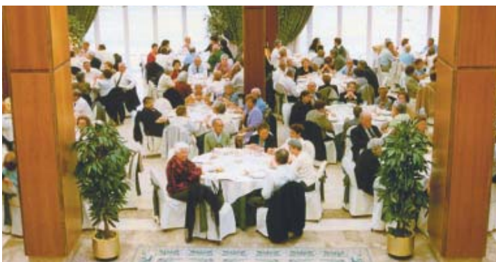
En la imagen, el pasado Homenaje a los Mayores en San Miguel

" Abriéndonos al mundo "; éste es el lema con el que se presentan las XIV Jornadas de Mayores del municipio, que se celebrarán del 9 al 12 de diciembre.