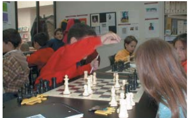
El ajedrez, una de las propuestas de ocio

Este espacio es una llamada a la participación , por lo que los responsables de este programa están abiertos a cuántas sugerencias puedan realizarse , tanto individualmente como colectivamente; de manera, que los grupos y asociaciones juveniles de Las Rozas puedan presentar sus proyectos de ocio alternativo.