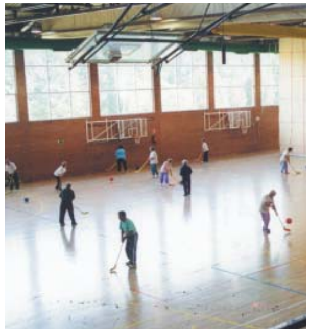
La práctica deportiva, un hábito saludable a cualquier edad

También existen Bonodeportes en las modalidades de Bono Joven (112 Euros/Año) y Bono Adulto (150 Euros/Año)