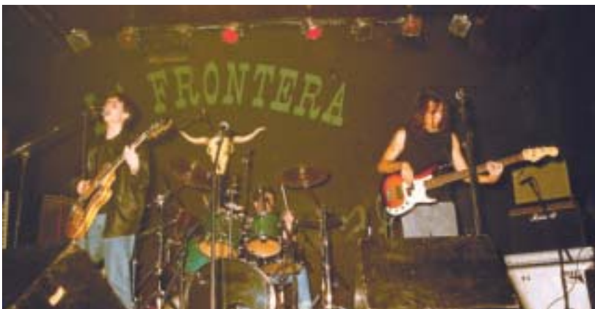
Un momento de la actuación del grupo ganador, "Heart Beat"

Cada año, la calidad de los grupos que se presentan a este Certamen de Música Joven vuelve a ser uno de los componentes más destacados.