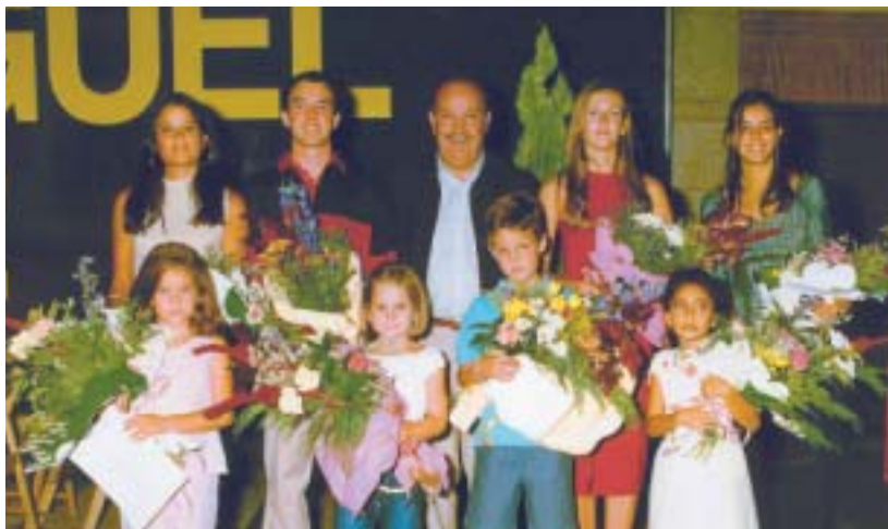
El Alcalde de Las Rozas con las Reinas, Reyes y Damas de Honor de San Miguel 2002. ¡Enhorabuena!