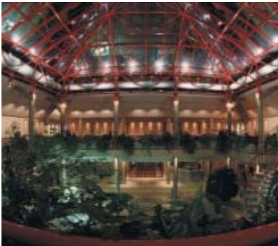
La "Plaza interior" del Centro congrega muchos actos

Con motivo del Día Internacional del Voluntariado , la Concejalía de Servicios Sociales y Mujer organiza, el 5 de diciembre, una serie de actividades con el objetivo de implicar y sensibilizar a los ciudadanos del municipio sobre la problemática social del entorno, recogiendo, además, las demandas de todas aquellas personas que precisen de una especial atención.