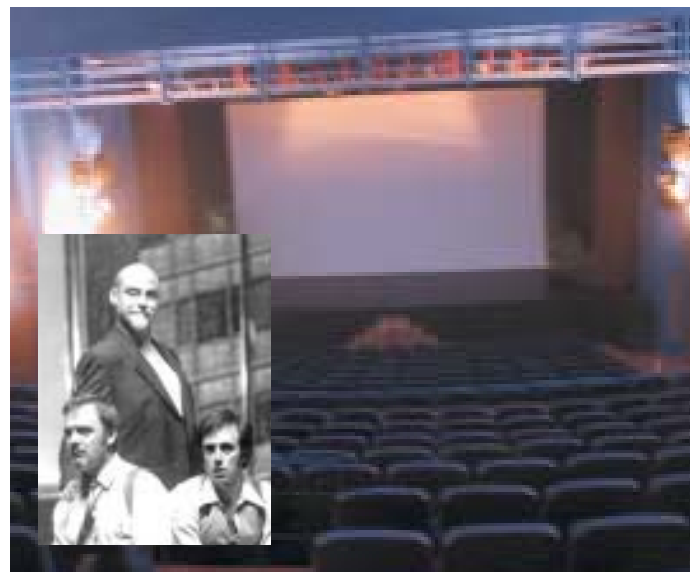
En el recuadro, los protagonistas de “Muerte accidental de un anarquista”.

Como en otras ocasiones, y con el objetivo de fomentar la práctica del arte dramático, también habrá lugar para los grupos aficionados del municipio. “El cianuro ¿solo o con leche?” de Juan J. Alonso Millán, a cargo del Grupo de Teatro de Molino de la Hoz (viernes 8 y sábado 9 de noviembre) y “Maribel y la extraña familia” de Miguel Mihura, por el Grupo de Teatro El Girasol (jueves 19, viernes 20 y sábado 21 de diciembre) serán las propuestas. Además, la Escuela de Arte Dramático del municipio ofrecerá una muestra de teatro en la que participarán los alumnos del nivel inicial. (Miércoles 4 y Jueves 5 de diciembre. 19.00 h.).